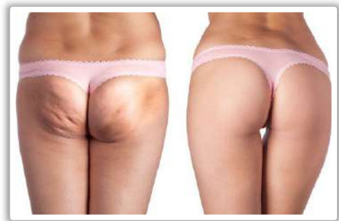
La celulitis puede percibirse en contracción o en reposo.

Ocurre principalmente en el sexo femenino y se localiza en regiones tales como glúteos, muslos y abdomen principalmente.